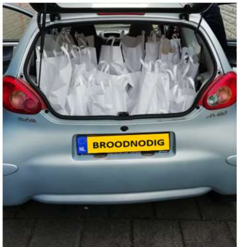
Auto vol met tasjes

Namens de ontvangers: Alle gevers hartelijk dank!